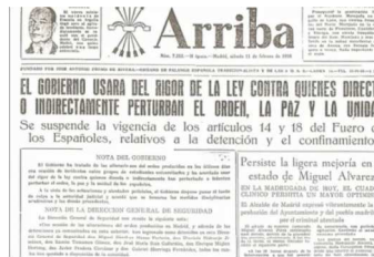
1956: el movimiento estudiantil antifranquista nace en San Bernardo