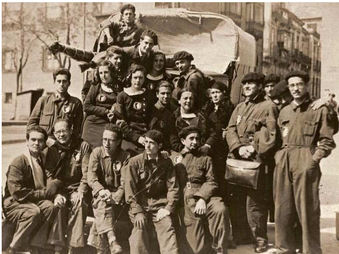
Los miembros de La Barraca con su característico mono azul