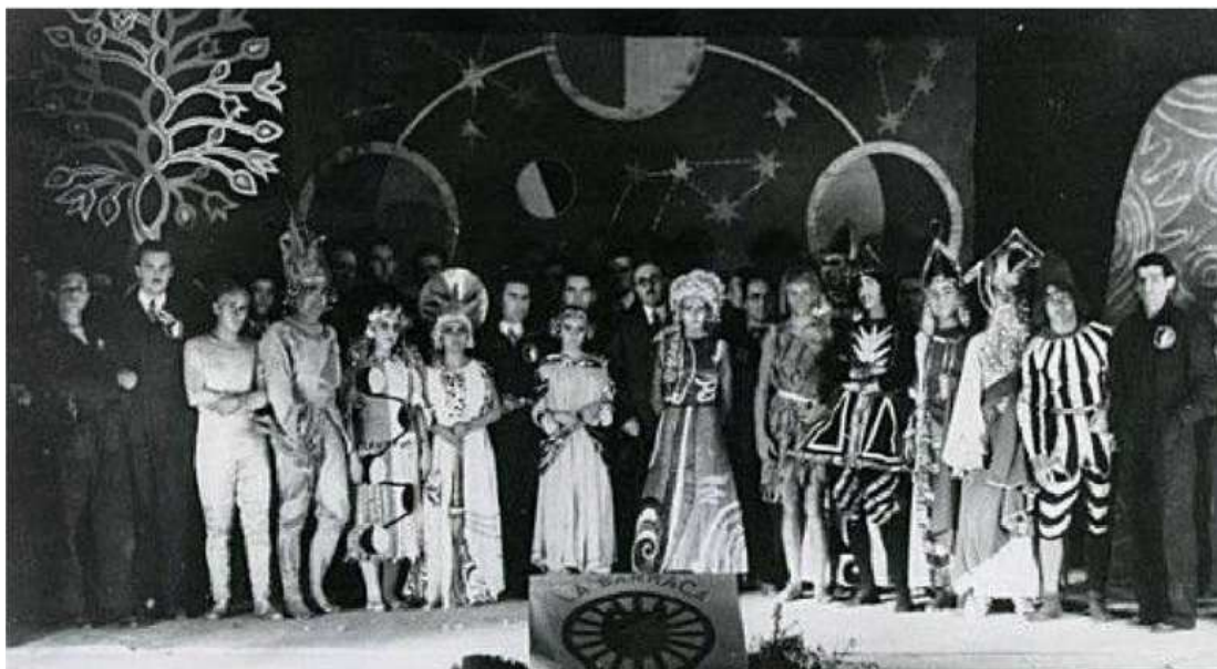
Representación de La vida es sueño en el Paraninfo de la Universidad Central

La primera función de La Barraca tuvo lugar el 10 de julio de 1932 en la plaza de Burgo de Osma, a la que siguió una pequeña gira con éxitos, pero también con la confrontación política de “enemigos de la República”, que acudieron a boicotear alguna representación, y algunos contratiempos organizativos, como sucedió cuando algún avisado puso a la venta entradas para su espectáculo gratuito.